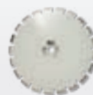
asfalto/cemento fresco – ad acqua – s. laser