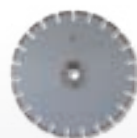
cemento invecchiato – a secco – s. laser