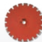
asfalto/cemento fresco – a secco – s. laser