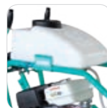
Serbatoio acqua estraibile di serie