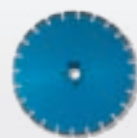
cemento invecchiato – ad acqua – s. laser